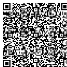
Esbonio Clotiau Gwythiennol