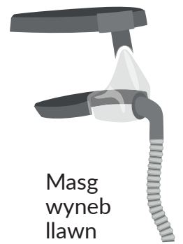
Masg wyneb llawn