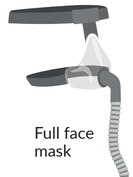
Full face mask